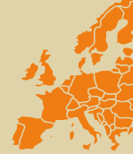
Bürgerdebatte Raumfahrt Europa